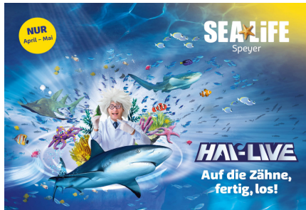
HAI-LIVE im SEA LIFE Speyer